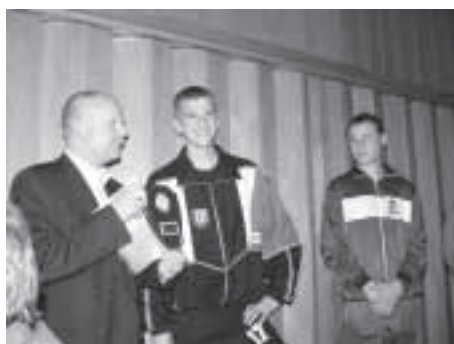
Geschenke für unsere Partnerstädte