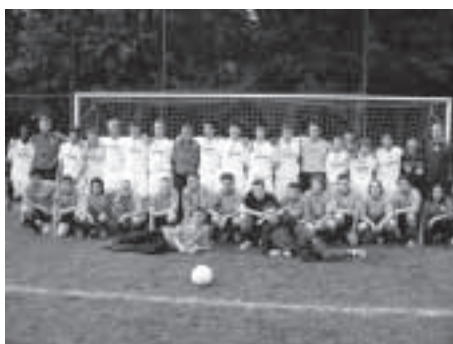
MFC und VFL Bochum