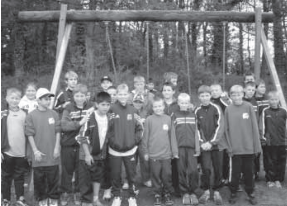
Teilnehmer des MFC

Bei dem wahnsinns Turnier in Zerf unterlagen wir lediglich im Endspiel dem Verein Eintracht Trier und belegten somit den 2ten Platz. Unsere D 2 wurde 4ter und die E-Jugend belegte auf dem D-Jugend-Turnier den 5. Platz.