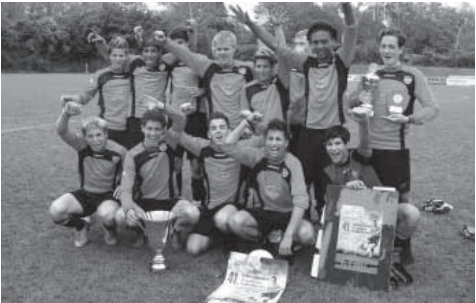
Gewinner: SSV Reutlingen