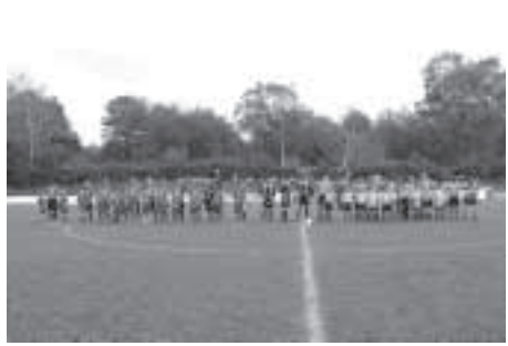
Endspiel: SSv Reutlingen - SV Eindhoven