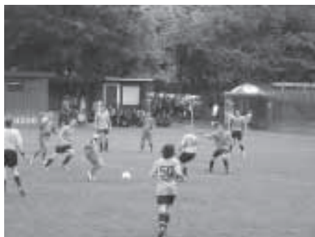
... und Schuss