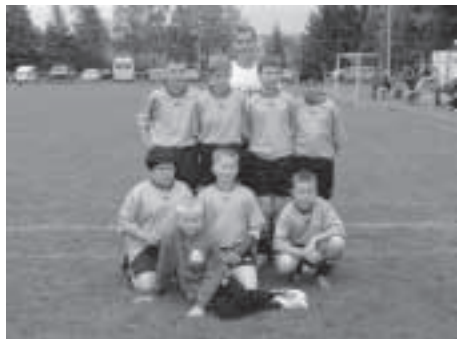
Eine Mannschaft von 3 MFC-lern