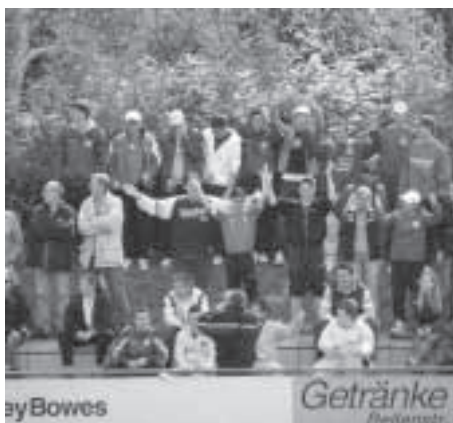
Fanblock des MFC