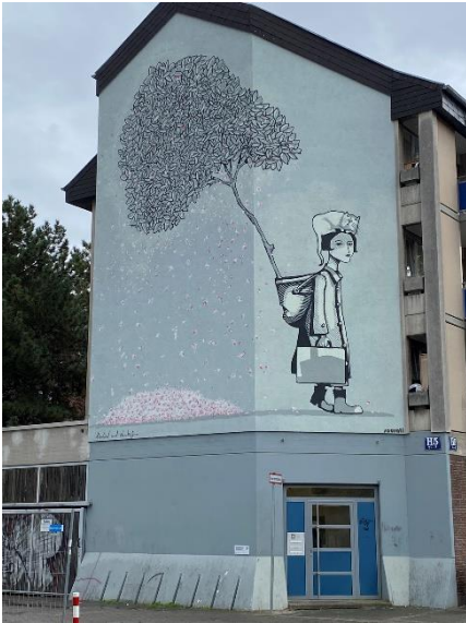
Abschied und Neubeginn Sourati