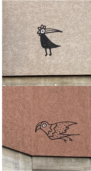
Die Vögelchen sind, glaube ich zumindest, auch von Sourati