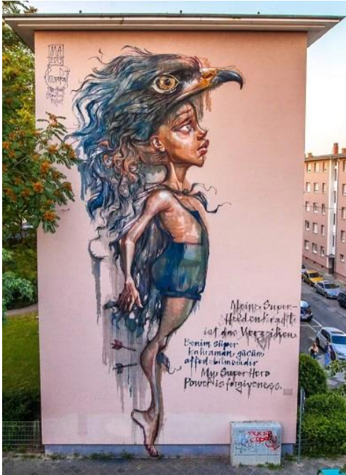
My Superhero Power is forgiveness

Am 28.10.23 war es soweit. Unser diesjähriger Ausflug führte uns in die Mannheimer Innenstadt, um die Murals innerhalb der Quadrate zu besichtigen und etwas über die Künstler sowie deren Botschaft zu erfahren.