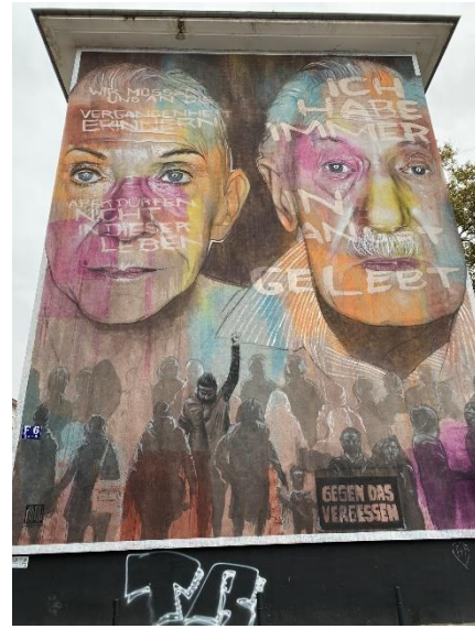
Gegen das Vergessen AKUT