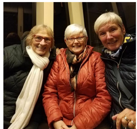
Drei Mädels in der Linie 1