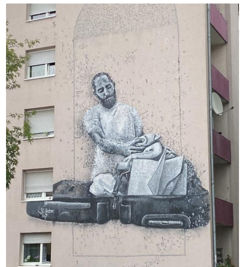
The inevitability of Leaving things behind

Die Farben sind leider schon etwas verblasst. Eigentlich hat das Bild einen gelben Hintergrund. Warum diese Farbe nicht mehr sichtbar ist kann man mit Sicherheit nicht sagen. Dieses Bild soll uns sagen, was lasse ich zurück und was nehme ich mit, wenn ich gehen müsste.