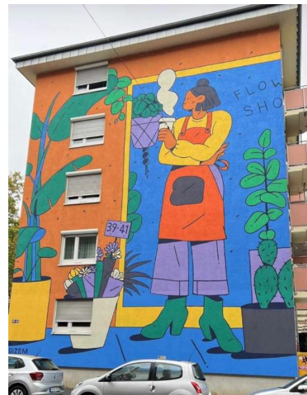
Flower Shop Gizem Winter

Die Heimfahrt haben wir alle mit den öffentlichen Verkehrsmitteln angetreten und waren so gegen 20:30 Uhr zu Hause. Heidi hat allerdings etwas länger gebraucht?? 😊